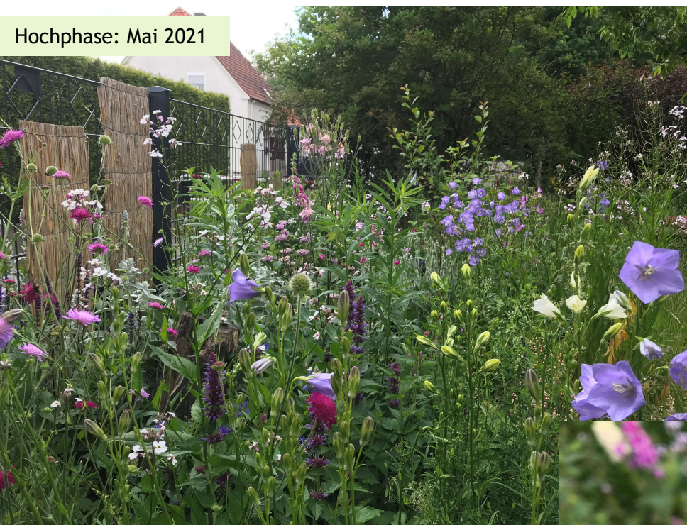
Hochphase: Mai 2021