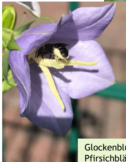
Glockenblumen-Scherenbiene auf Pfirsichblättriger Glockenblume.