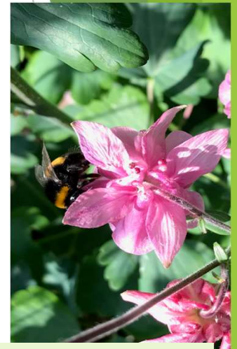
Erdhummel auf Akelei