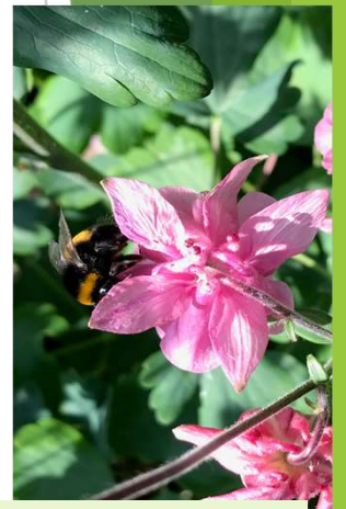
Erdhummel auf Akelei