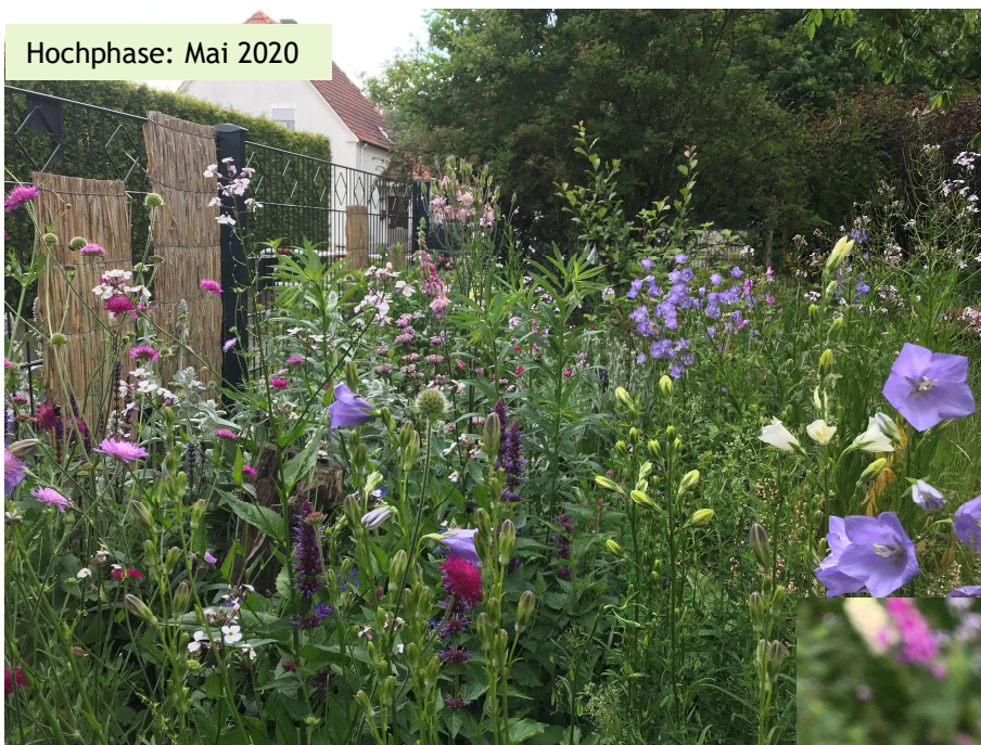
Hochphase: Mai 2020