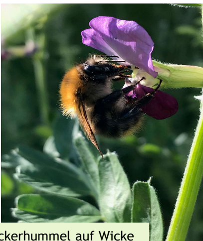
Ackerhummel auf Wicke