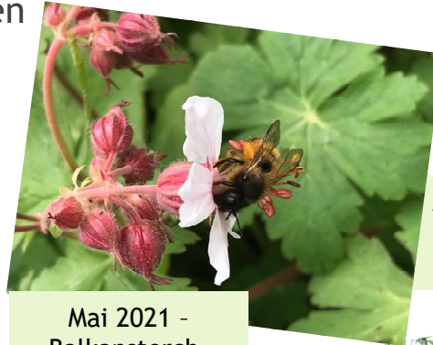
Mai 2021 - Balkanstorchschnabel wird belagert von Hummeln und Mauerbienen