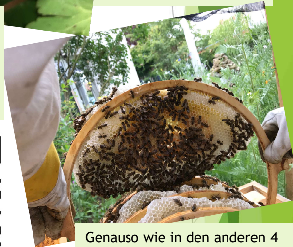
Genauso wie in den anderen 4 Beuten bauen die Bienen ihre Waben selbst.