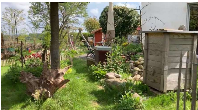
01.05.2022 - Blick auf das Bienendorf