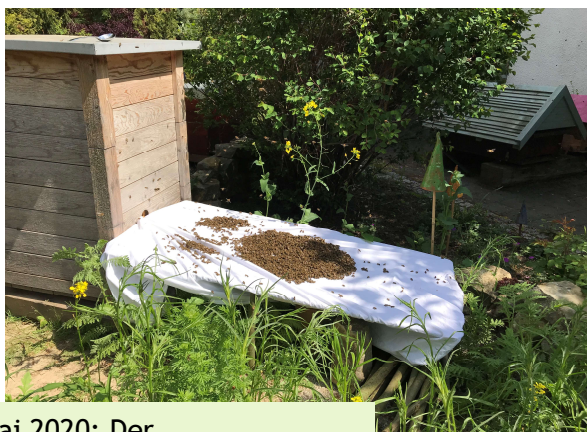
Mai 2020: Der Honigbienenschwarm läuft in die Bienenkugel ein.