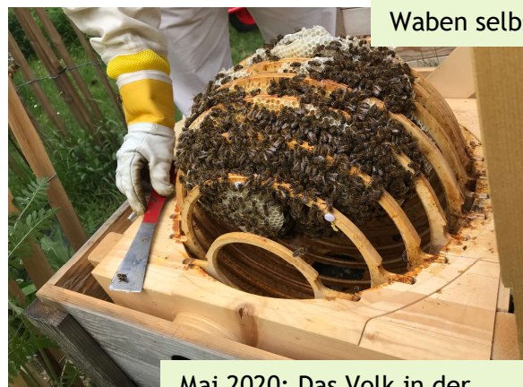
Mai 2020: Das Volk in der Bienenkugel mit der ersten verdeckelten Brut